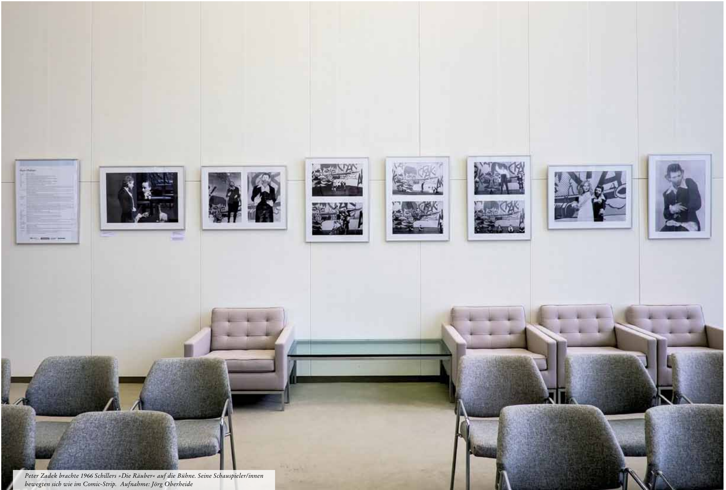
Peter Zadek brachte 1966 Schillers »Die Räuber« auf die Bühne. Seine Schauspieler/innen bewegten sich wie im Comic-Strip.