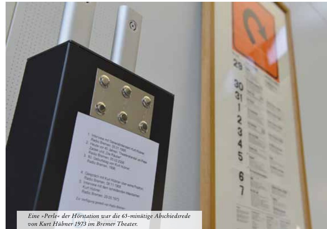
Eine »Perle« der Hörstation war die 65-minütige Abschiedsrede von Kurt Hübner 1973 im Bremer Theater.

Zitat aus der Abschiedsrede von Kurt Hübner am 28. Mai 1973