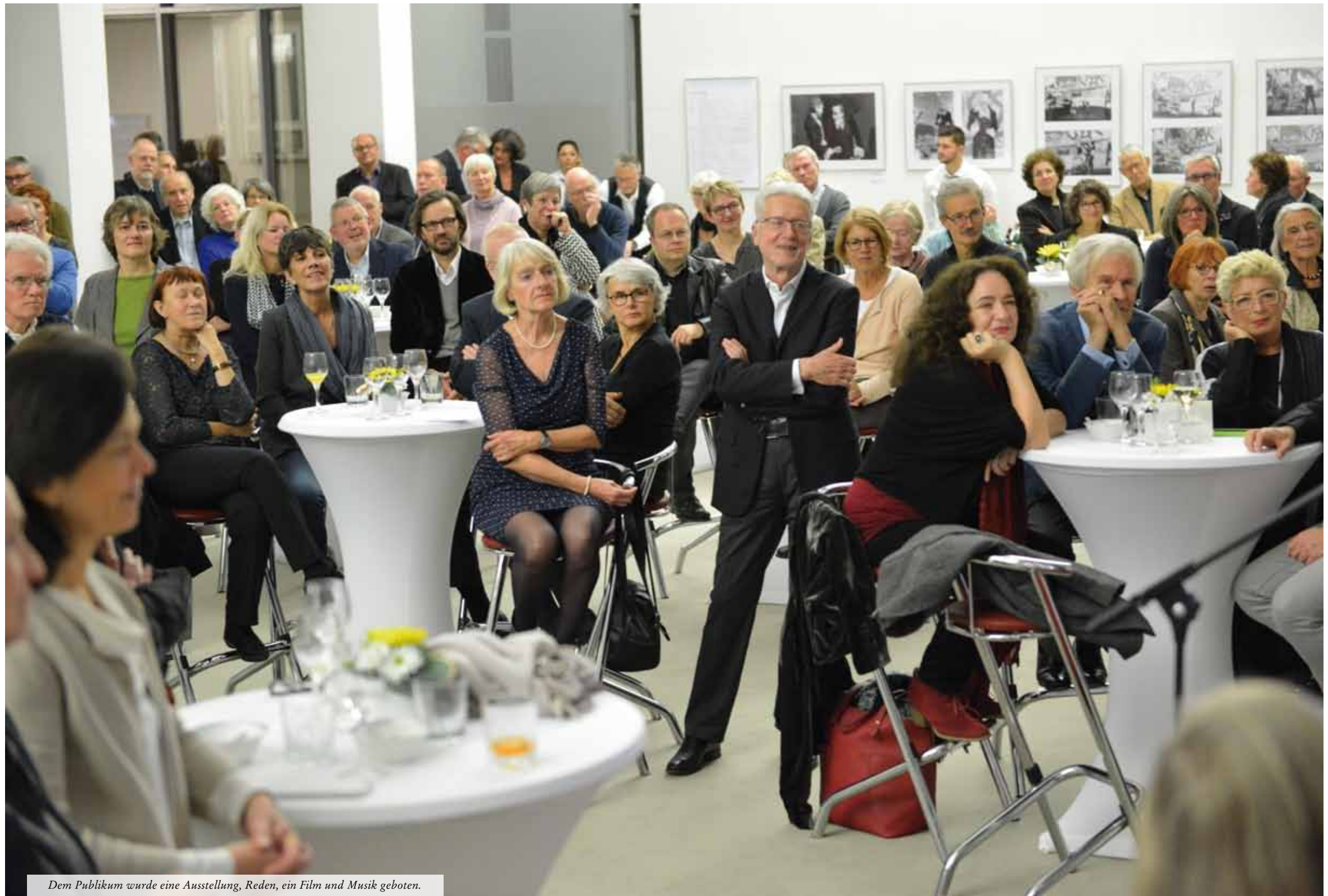
Dem Publikum wurde eine Ausstellung, Reden, ein Film und Musik geboten.