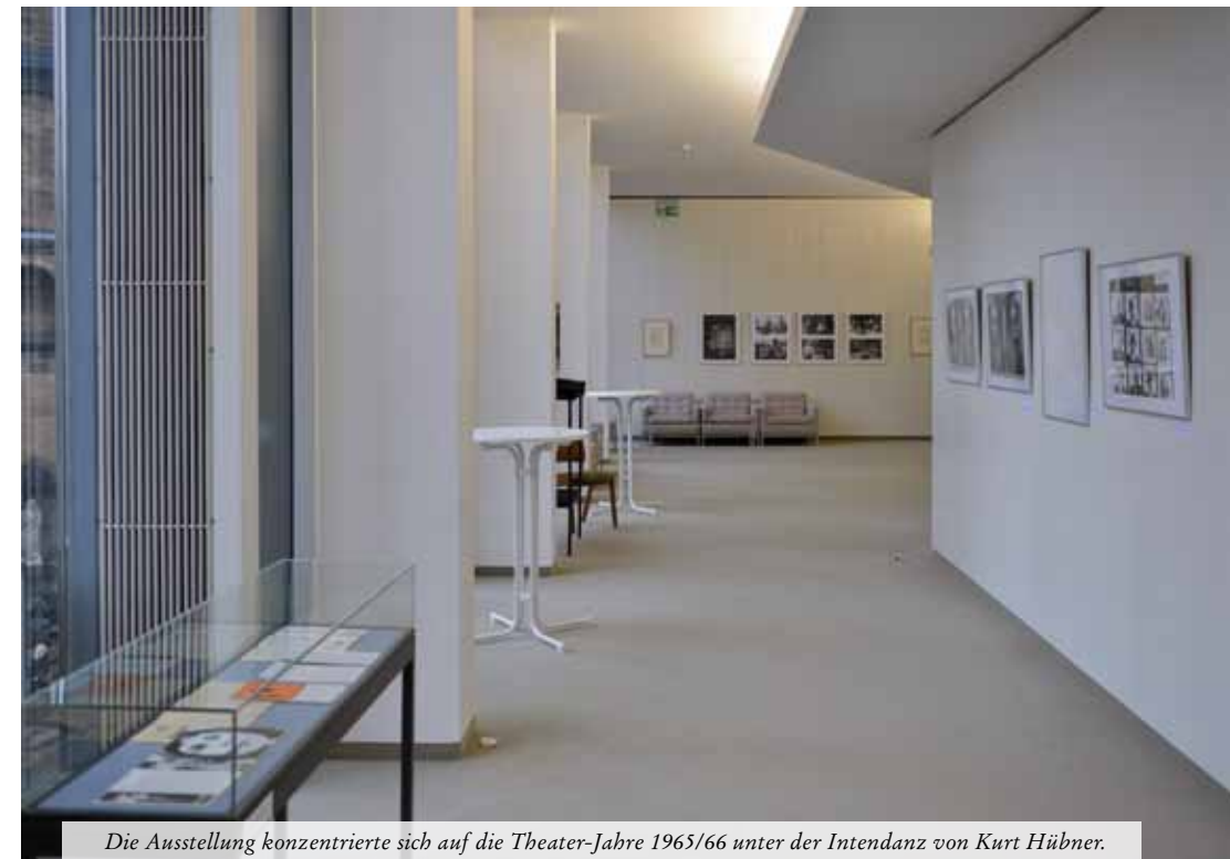
Die Ausstellung konzentrierte sich auf die Theater-Jahre 1965/66 unter der Intendanz von Kurt Hübner.