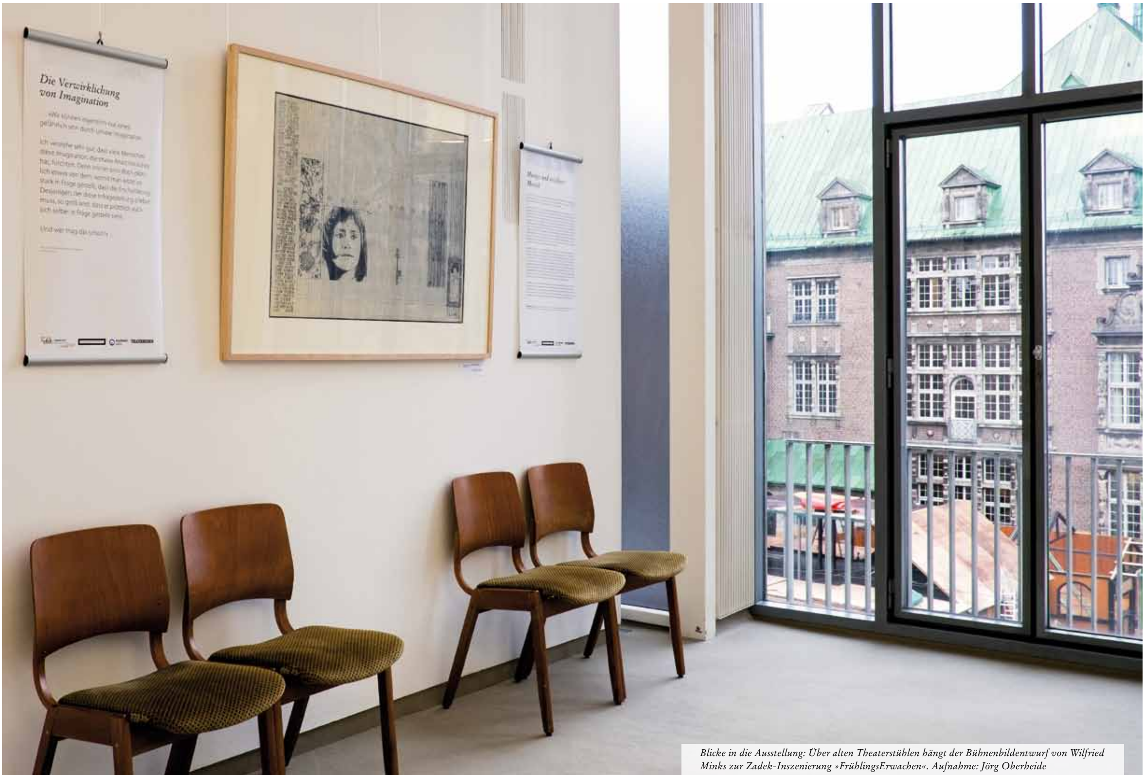
Blicke in die Ausstellung: Über alten Theaterstühlen hängt der Bühnenbildentwurf von Wilfried Minks zur Zadek-Inszenierung »FrühlingsErwachen«.