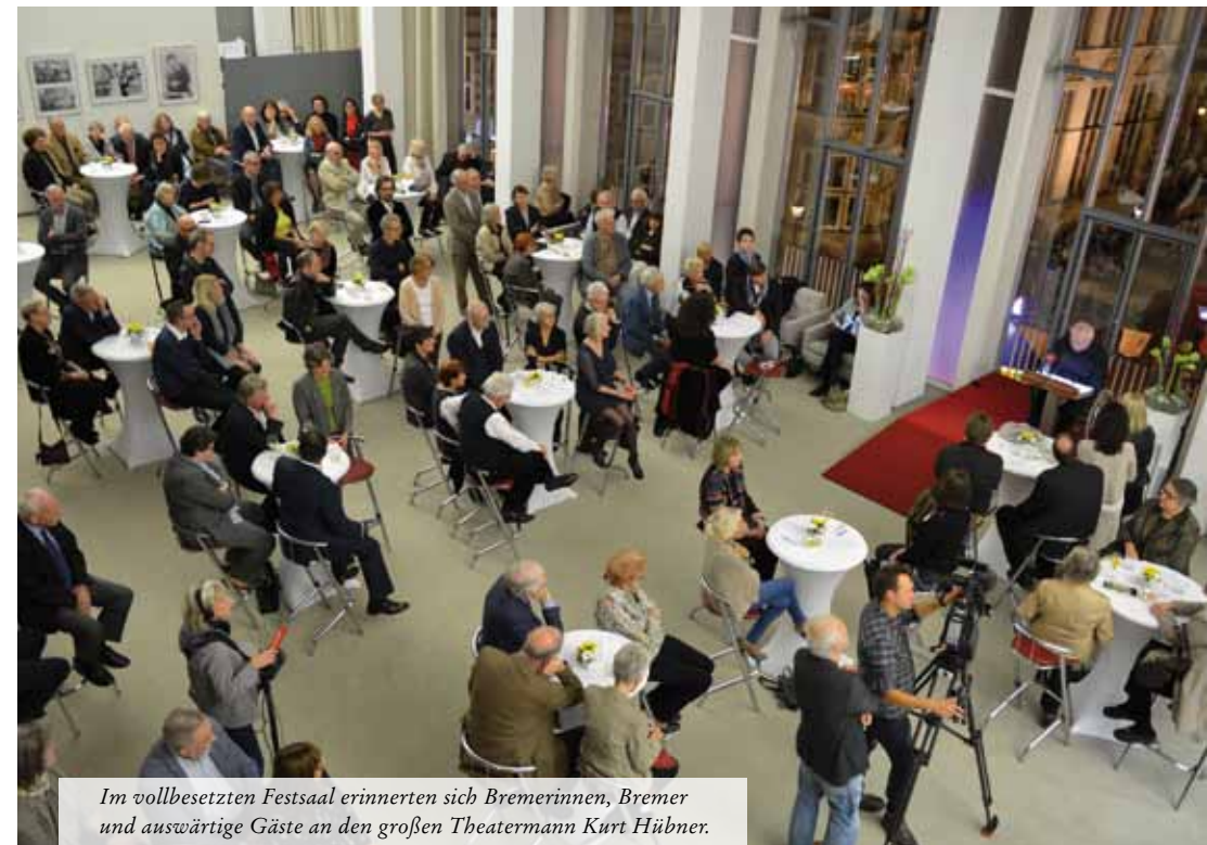
Im vollbesetzten Festsaal erinnerten sich Bremerinnen, Bremer und auswärtige Gäste an den großen Theatermann Kurt Hübner.